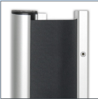
Standard-Rollo zum Schrauben