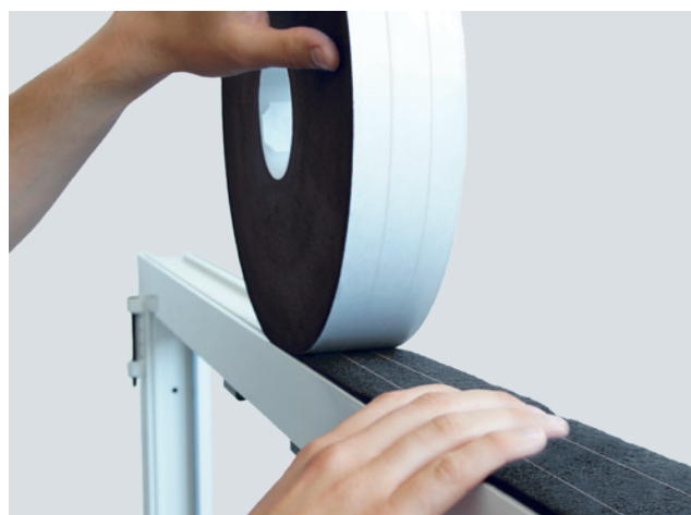
Einbaubeispiel: ISO-BLOCO HYBRATEC

* Bauteilbewegungen und temporäre Längenänderungen der vorhandenen Fugen sind bei der Ermittlung der geeigneten Banddimension zu berücksichtigen.